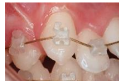
Keramische Logic bracket