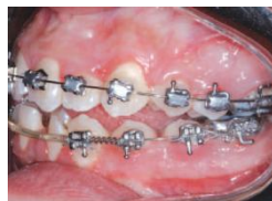
Metalen Logic bracket

Met deze Logic Line ™ Step-brackets kan u echter ook een gewone metaal of plastic-ligatuur gebruiken om de draad stevig in het slot te duwen en zo optimaal te gaan torquen of de tand in positie te houden.